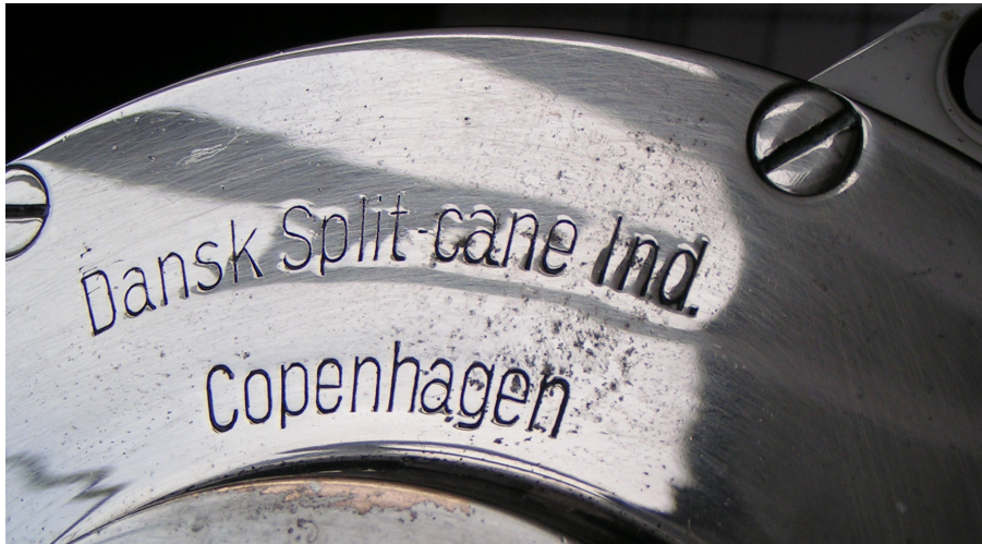
Der er megen spejleffekt i gavlene på de to hjul, men de er nok værd at kigge på alligevel. De ligner meget hinanden, men kun det til venstre er mærket. De lå hos samme sælger på lørdagens træf