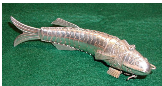
Hovedvandsæg i sølv

Lignende figurer kendes også som såkaldte hovedvandsæg, som kan åbnes, således at et stykke stof eller lign. kunne parfumeres, og dermed overdøve kedelige dufte i huset eller fra husets beboere. Ud over mere praktiske formål – kender vi typen i alt fra pyntegenstand til nøgleringe og lign. vedhæng, og også som agn til praktisk fiskeri.